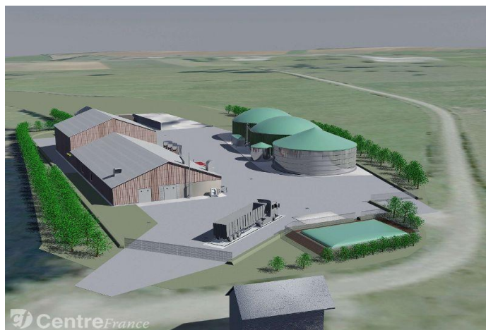
Usine de méthanisation